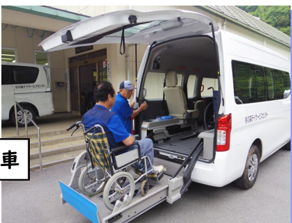
リフト付き送迎車

車いすご利用の方でもリフト付きの車輛で、ご自宅まで送迎します。（もちろん無料です。）