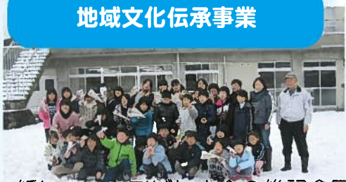
紙ヒコーキ飛ばし大会の後記念写真。 景品もありました