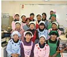
↑食生活改善推進協議会 金城支部のみなさん