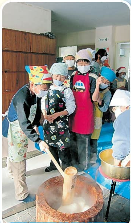
地域文化伝承事業