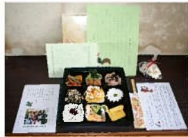
↑小・中学生の手紙も一緒に お届けしました♪