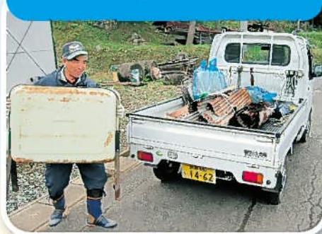
粗大ゴミ搬出支援事業