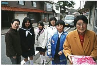
「小・中学生も一緒に お弁当を配りました♪」