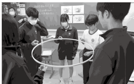
金城中学校・くざの里