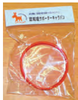
認知症サポーターの証 オレンジリング

認知症は誰にでも起こりうる病気で、決してひと事ではない問題です。皆さん熱心に受講されました。