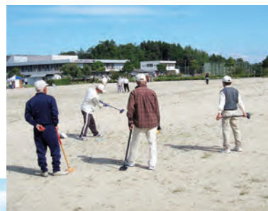
準備体操してから始めましょう!

当日は、天候にも恵まれ、78名の参加者はグラウンドゴルフを楽しまれ、たくさんの笑顔がありました。