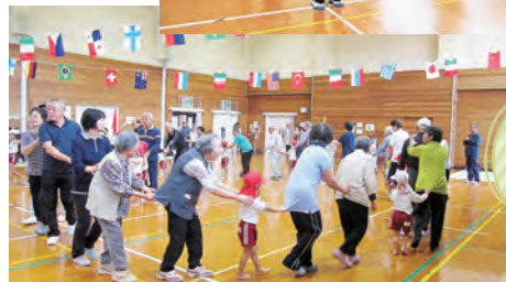
子どもと一緒にじゃんけん列車!