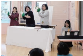
「おはなしの会そらまめ」のみなさん

みすみっ子サロンは、毎月第3火曜日に開催しています。毎回楽しい内容を計画し、在宅児とその保護者のみなさんの交流を目的に開催しています。みなさん、ぜひご参加ください。