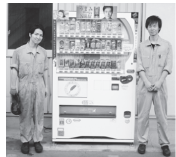
【㈱オートパールみどり】