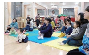
みんないい子で聞いています