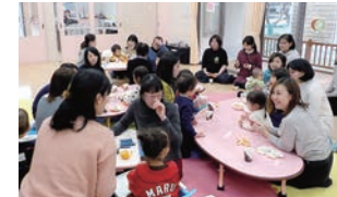
おやつ時間♪おしゃべりが止まりません