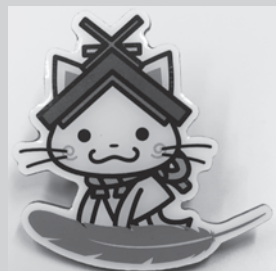
白黒で掲載しておりますが、実際はカラーです。